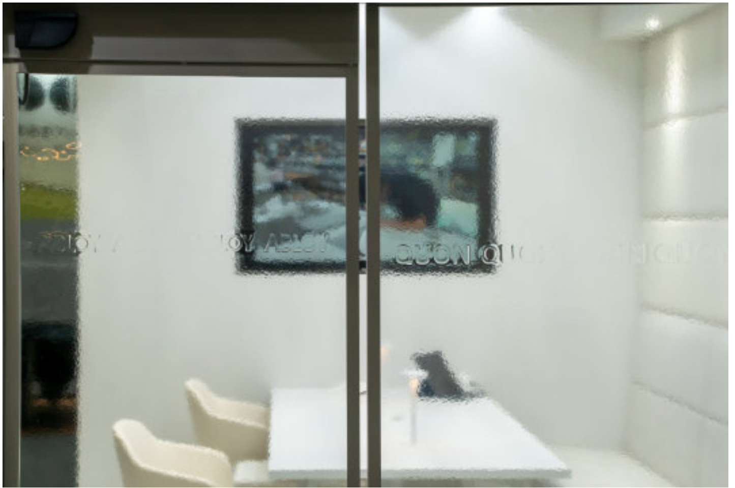
※オルガテック東京2022「ベストプレゼンテーションAWARD」準グランプリQUONブース(オーター)